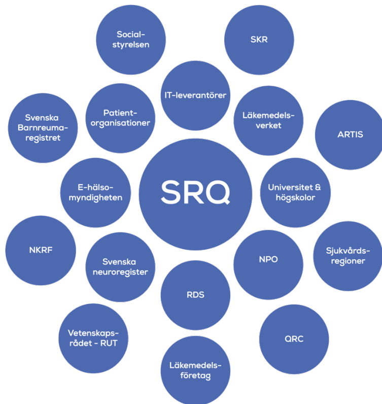
Figur 2: Samverkan

Denna figur beskriver SRQ:s samverkan med andra organisationer.